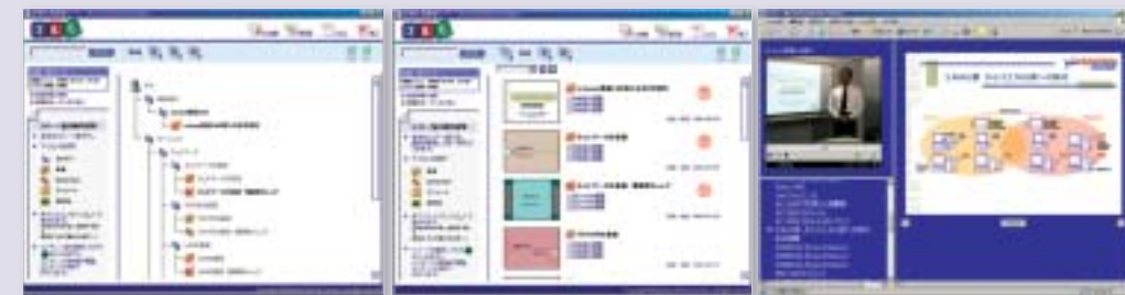
階層カテゴリーで表示したり、コンテンツの一覧表示が可能(左、中)。動画の進行に応じてプレゼンテーションのページが自動的に変化する(右)

のExamは、研修や教育した内容の習熟度などをチェックできる評価機能を提供するものである。管理者は、質問項目などを考えさえすれば、すぐにアンケート、クイズ・テスト問題を作成できるという。習熟度を高めるため、コンテンツを閲覧後に復習テストを実施し、合格するまで次のコンテ